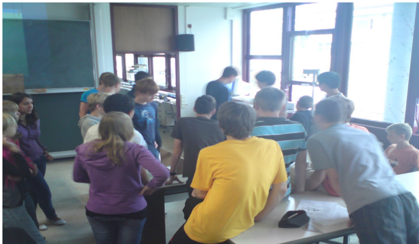
Bau des Solargrills.